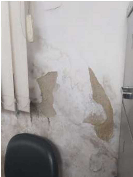
Figura 4 – Interior da edificação