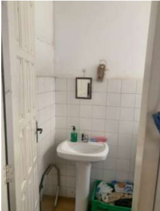
Figura 12 – Interior da edificação