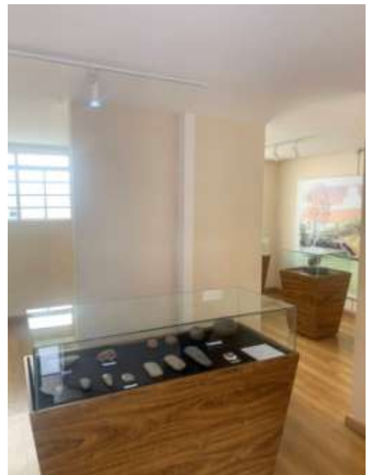
Figura 15 – Sala de exposição