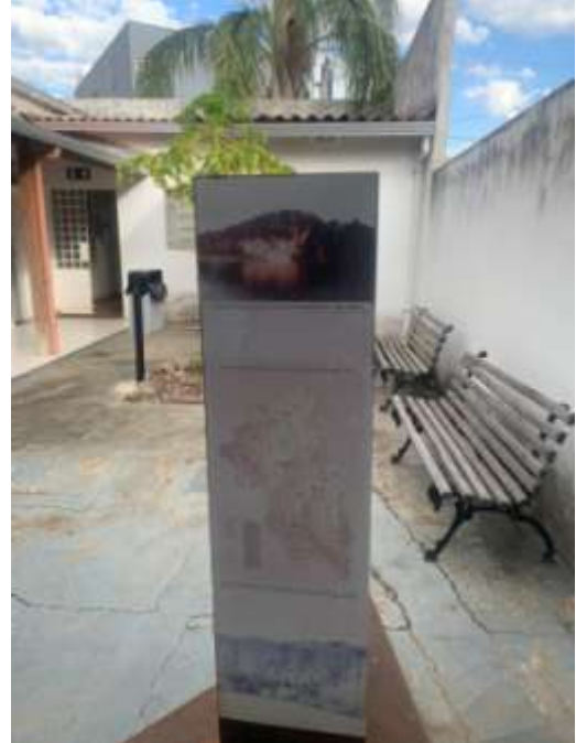
Figura 9 – Área da edificação