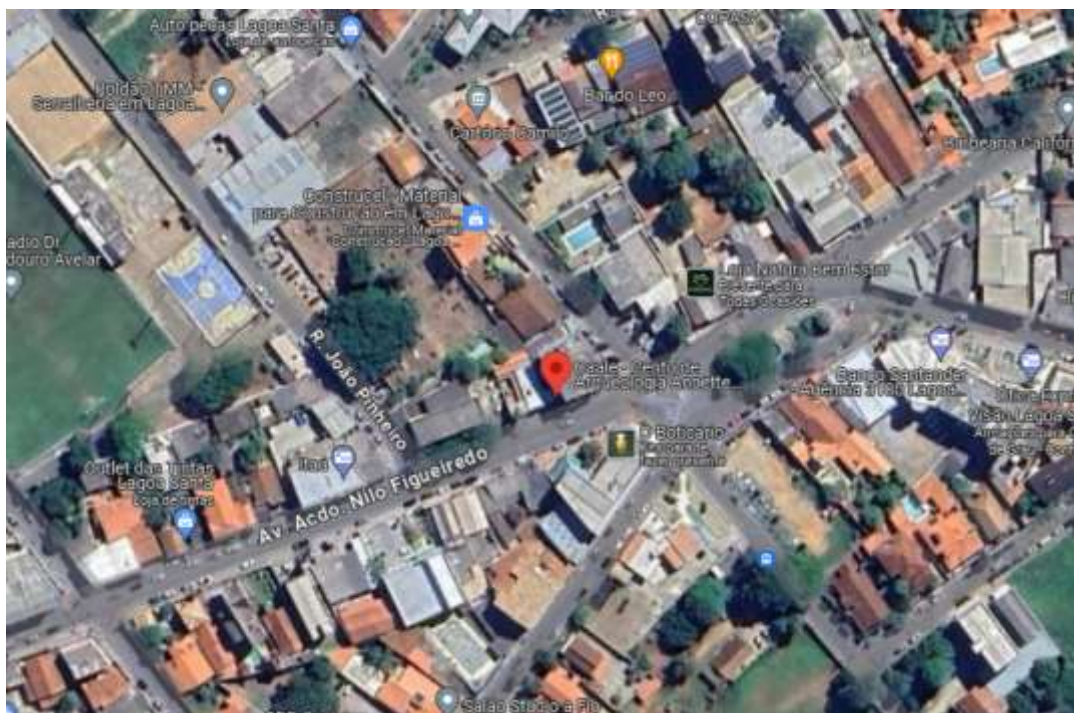
Figura 1- Imagem do Google Maps.

OBJETO: CONTRATAÇÃO DE EMPRESA ESPECIALIZADA PARA REALIZAÇÃO DE REFORMA E AMPLIAÇÃO DO CENTRO DE ARQUEOLOGIA ANNETTE LAMING EMPERAIRE - CAALE, COM FORNECIMENTO DE MATERIAS, EQUIPAMENTOS NECESSÁRIOS E MÃO DE OBRA.