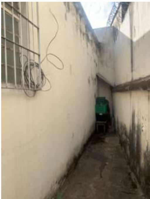
Figura 6 – Área da edificação