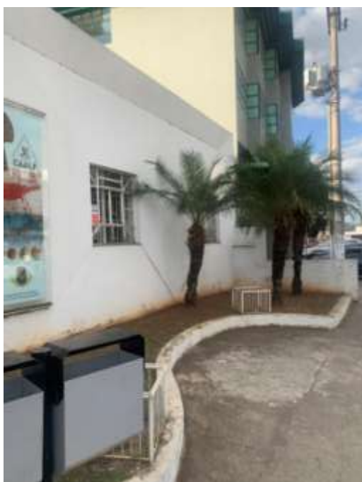
Figura 2 – Vista externa do CAALE