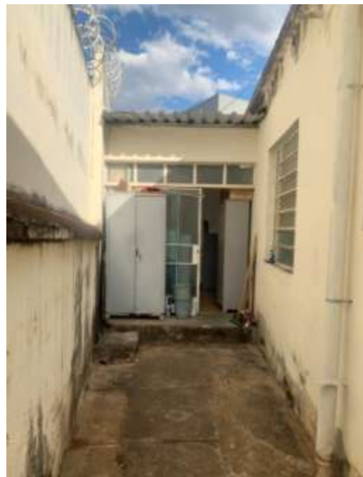
Figura 7 – Área da edificação