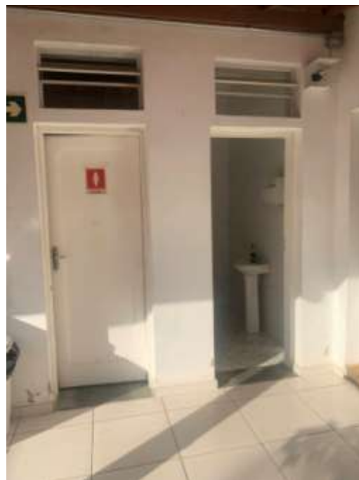
Figura 17 – Interior da edificação