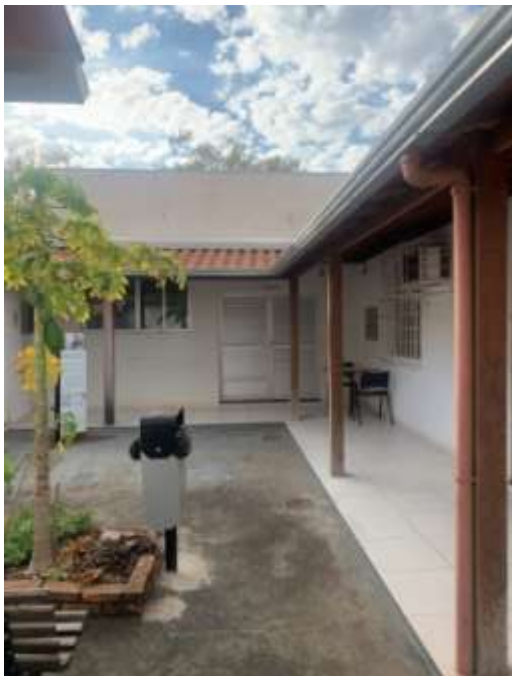
Figura 10 – Área da edificação