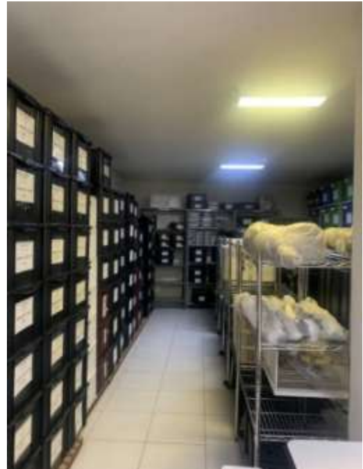
Figura 13 – Reserva técnica