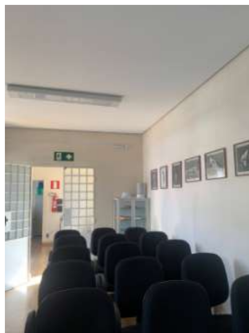
Figura 3 – Interior da edificação