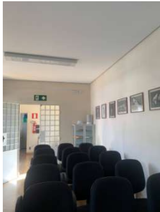
Figura 5 – Interior da edificação