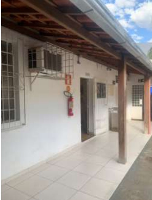
Figura 8 – Área da edificação